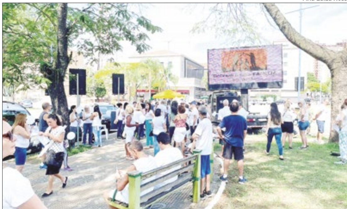
Manifestação contra o aborto em Volta Redonda aconteceu na Praça Brasil (à direita) e Barra Mansa fez o ato na Praça da Matriz, no Centro

Interior do Estado do Rio promove manifesto, a exemplo do restante do país