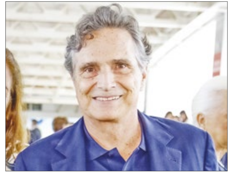
Defesa da entidade Educafro irá recorrer no STF