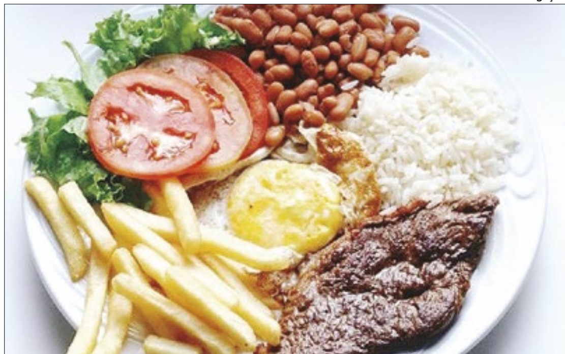
Brasileiro gasta R$ 29,40 em média para comprar um prato feito

Duas regiões do país ofertam a refeição básica com preços acima da média nacional: Nordeste (R$ 30,23) e Sudeste (R$ 30,14). O Centro-Oeste é a que tem o prato comercial mais em conta, por R$ 25,43, em média. Se o brasileiro opta por comer uma fruta em vez de ingerir a bebida não alcoólica, o custo sobe e a média nacional passa a ser de R$ 33,30 alta de 13%. Os dados são da pesquisa Preço Médio da Refeição Fora do Lar 2023, realizada pela Mosaiclub e encomendada pela ABBT (Associação Brasileira das Empresas de Benefícios ao Trabalhador). A pesquisa foi