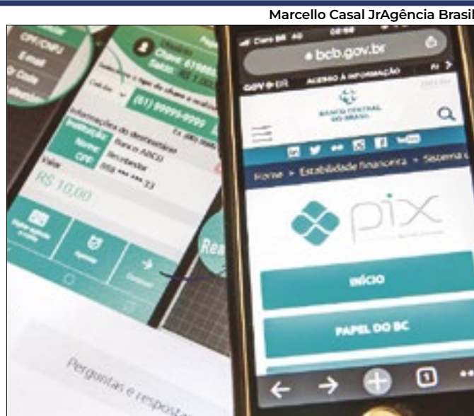
Segundo caso de golpe no Pix é descoberto