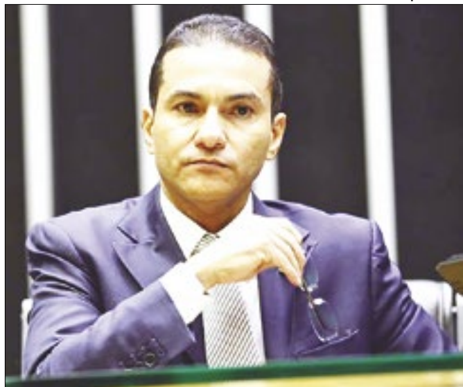
Vice-presidente da Câmara não anulou votação