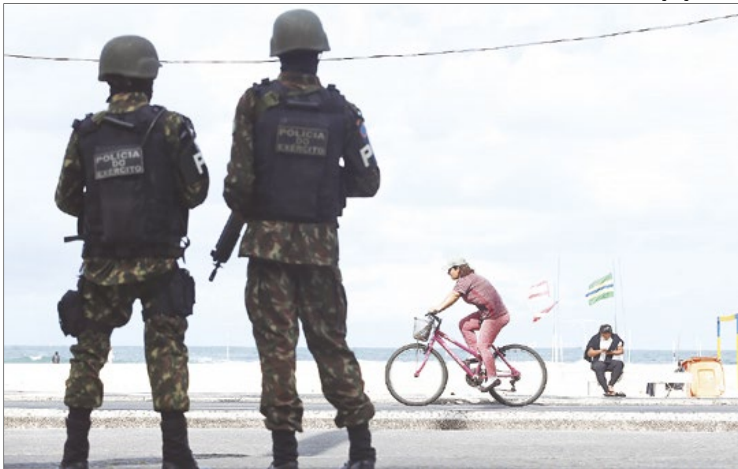
Policiais do exército fazem patrulha na praia do Leme, zona sul do Rio de Janeiro.

A lei, se aprovada, irá classificar o homicídio e a lesão corporal de turistas como crimes hedion-