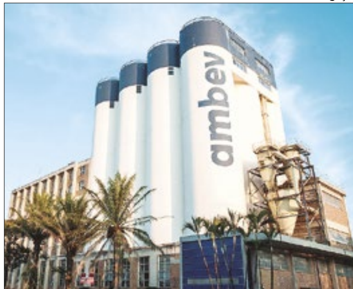
Ambev deverá pagar indenização para ex-funcionário da empresa

O TRT-15 (Tribunal Regional do Trabalho da 15ª Região), com sede em Campinas (93 km de SP), reconheceu a responsabilidade da Ambev pelo alcoolismo crônico e pela depressão grave de um ex-funcionário. Por unanimidade, o colegiado condenou a fabricante de bebidas ao pagamento de R$ 600 mil de indenização. Cabe recurso.