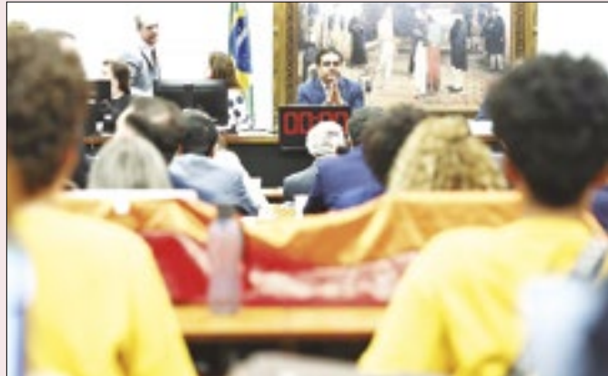
Votação da união civil na comissão de Família