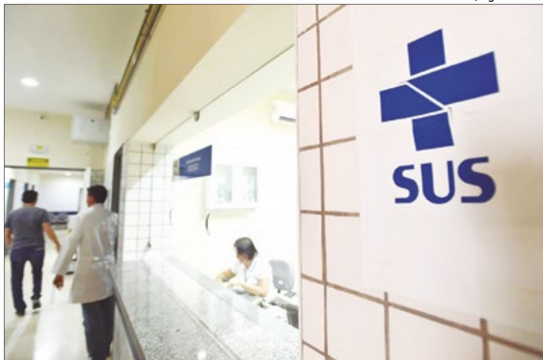
Tratamento pediátrico personalizado existe desde 2021

Graças a uma parceria entre a Tucca e o Santa Marcelina, que existe desde 2001, crianças e adolescentes com câncer atendidos pelo SUS têm tido acesso a mapeamento genético de tumores e a tratamentos mais