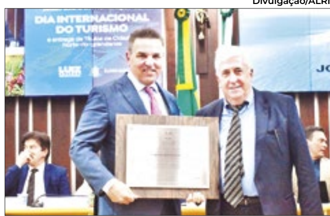
Prêmio entregue ao empresário no Rio Grande do Norte