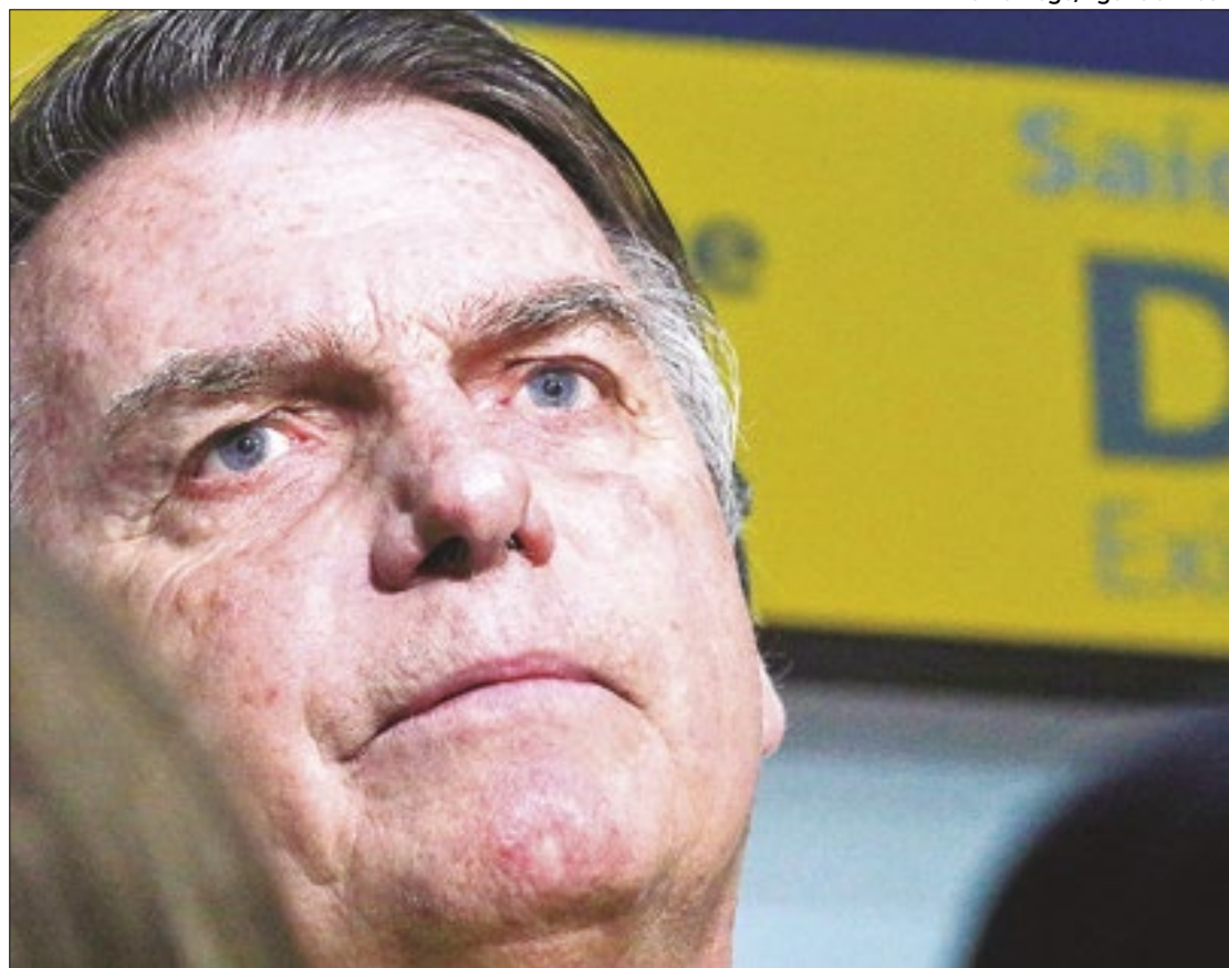
TSE pode não repetir condenação do ex-presidente da República