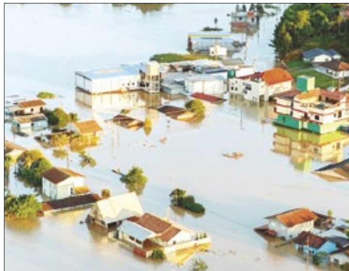
Força-tarefa no combate aos desastres em Santa Catarina