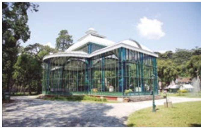
Palácio de Cristal receberá programação gratuita