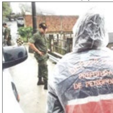
Visitação da Marinha Brasileira

A Prefeitura de Petrópolis, por meio da Secretaria de Proteção e Defesa Civil, recebeu a visita da Marinha Brasileira, na última semana. O objetivo do encontro foi a integração entre as instituições para