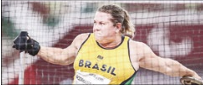
Competição será no Chile

JOGOS PARAPAN-AMERICANOS - O Comitê Paralímpico Brasileiro (CPB) anunciou a segunda relação de atletas que representarão o Brasil nos Jogos Parapan-Americanos de 2023, que serão disputados em Santiago (Chile) entre os dias 17 e 26 de novembro. Nesta terça-feira (3) foram convocados 108 atletas, 10 atletas-guia, três calheiros e dois goleiros de cinco modalidades diferentes.