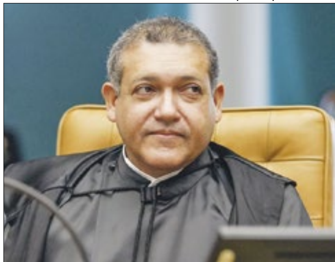
Ministro suspendeu quebra de sigilos de depoente