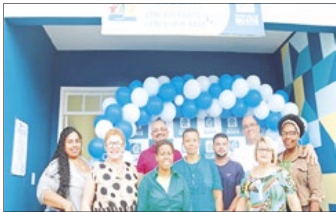
Gestores vão aprimorar ajuda aos imigrantes