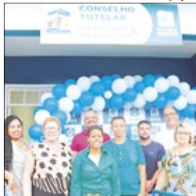
Cerimônia do fim da reforma

A obra de reforma da sede do Conselho Tutelar foi entregue durante uma cerimônia que aconteceu na tarde da última segunda-feira (2), um dia depois da eleição da definição dos novos conselheiros. O lugar, que fica na Rua Coronel Francisco Balbi, no centro, recebeu diversos serviços como nova pintura na área interna e externa do prédio, rampas de acesso, novas portas das salas e manutenção de toda a cobertura.