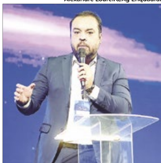
O governador do Rio Cláudio Castro durante seu discurso no evento que será realizado até a próxima sexta-feira

do nosso povo e, principalmente, ressaltou que as famílias celebram a tradição da cidade”, disse Rodrigo. O secretário de Governo, Luiz Furlani, que já tem o apoio de Drable para 2024, acompanhou todo o desfile. Não é bobo de perder uma oportunidade dessa.