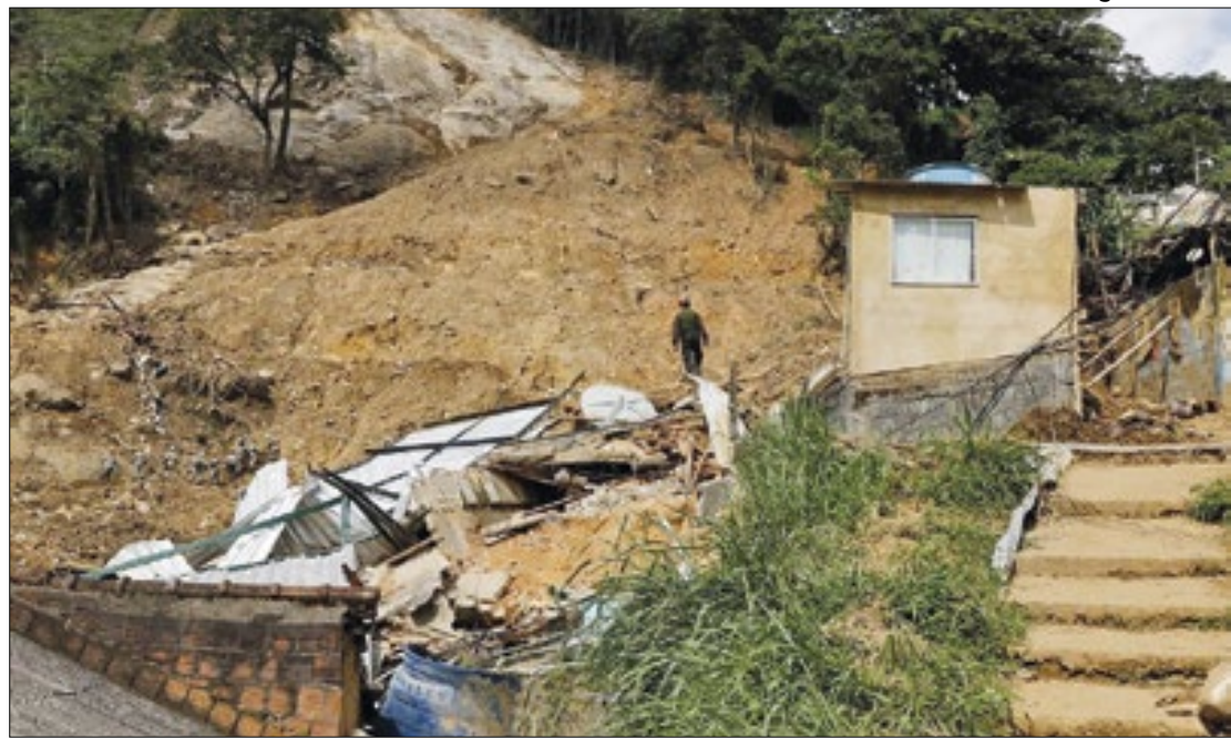
Em Petrópolis, tragédias que ocorreram em 2022 mataram mais de 240 pessoas

O período chuvoso é sempre carregado de preocupação na região. Os municípios foram atingidos pela maior tragédia climática do Brasil em 2011, quando mais de 900 pessoas morreram. A maior parte das vítimas estavam em Petrópolis, Teresópolis e Nova Friburgo.