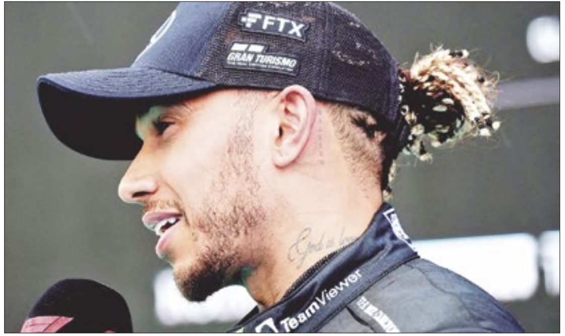
Hamilton assinou sua renovação de contrato com a Mercedes até 2025

De contrato renovado com a Mercedes, Hamilton hoje poderia estar fechado com a Ferrari. Em entrevista ao portal "Blick", o britânico admitiu que já teve conversas casuais com a escuderia italiana.