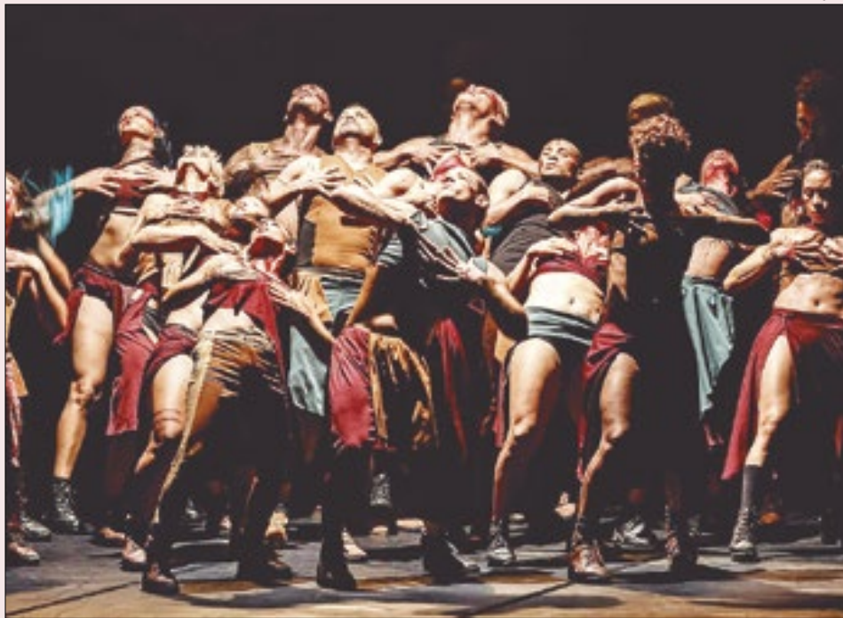
'TA - Sobre ser Grande' é um dos espetáculos do repertório do grupo