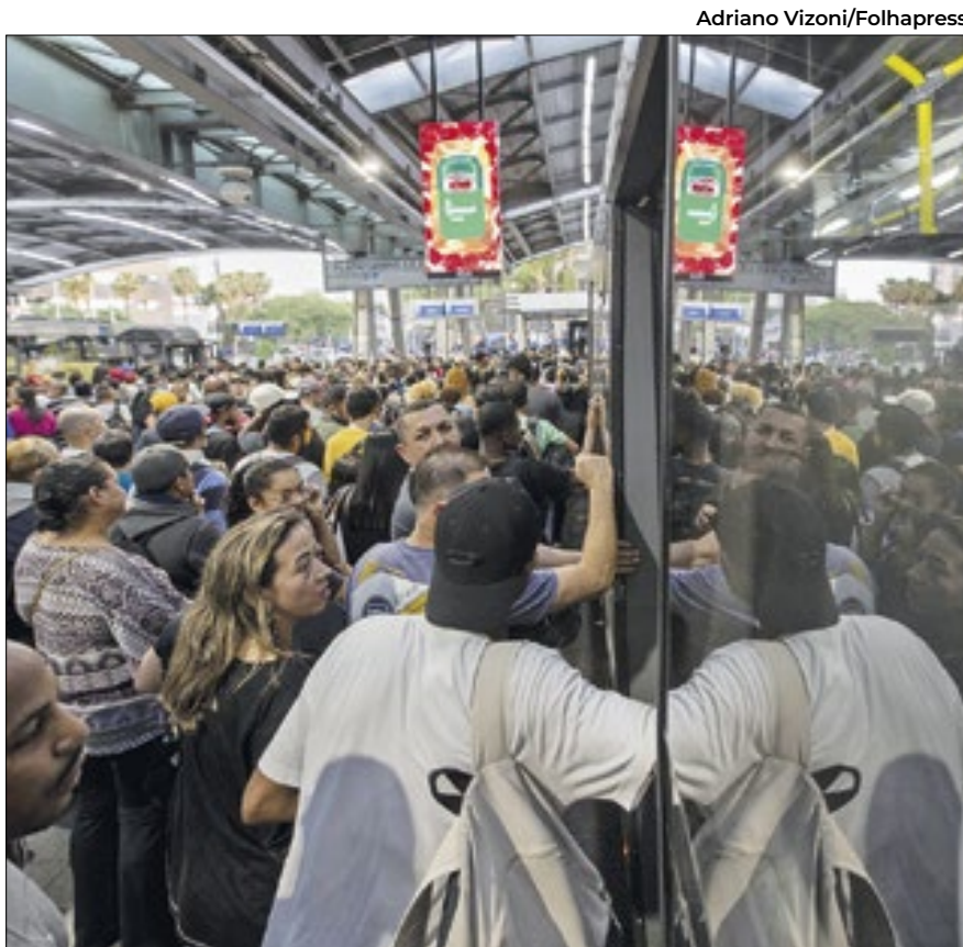
Movimentação no final da tarde desta terça na estação Pinheiros

Com informações de Tulio Kruse, Leonardo Zvarick e Lucas Lacerda (Folhapress)