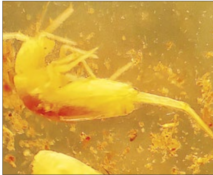
Animal em extinção de 1 mm só existe na caverna do PA