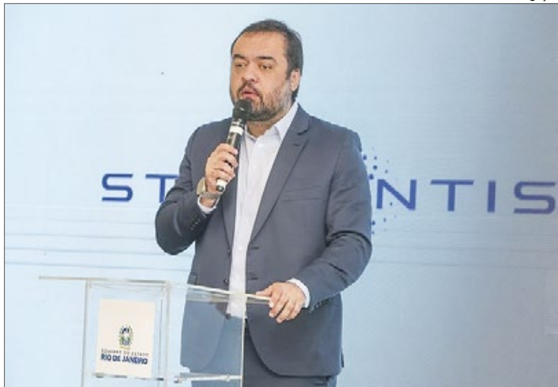
Cláudio Castro irá também a montadora de Porto Real durante visita

O governador do Estado do Rio, Cláudio Castro, vai levar o "Programa Governo Presente" à Região do Médio Paraíba. De quarta a sexta-feira, Castro e sua equipe farão uma maratona de visitas a seis municípios: Volta Redonda, Porto Real, Resende, Barra Mansa, Piraí e Valença, onde participarão de inaugurações de obras e anunciarão novos projetos.