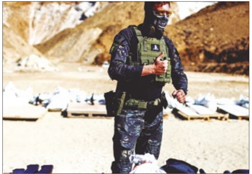
A Ucrânia diz ter recebido R$ 500 bilhões em ajuda militar até julho

A Otan alertou ontem que os estoques de munição usados pela aliança para manter o esforço de guerra da Ucrânia contra a Rússia estão acabando. "O fundo do barril já está visível", afirmou o almirante holandês Rob Bauer, mais alta autoridade militar do grupo.