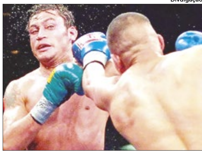
Campeão Mundial perdeu R$1,2 mi em pirâmide