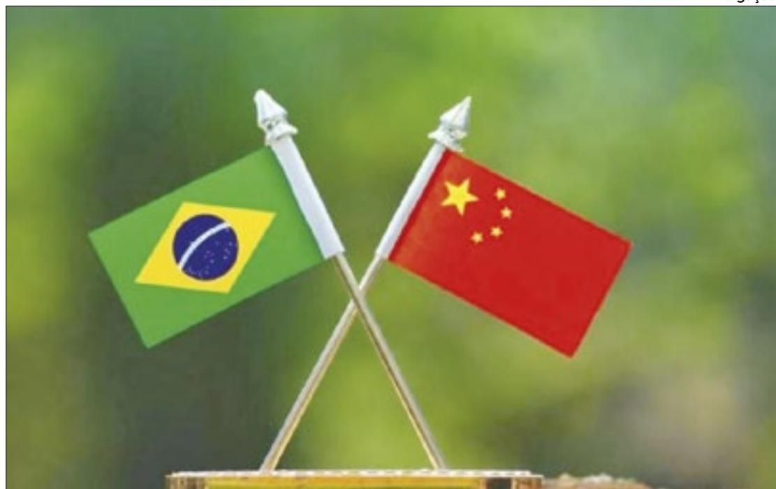
Negociação aconteceu inicialmente na moeda chinesa e depois convertida ao real

Estamos diante de um marco histórico para a economia brasileira e chinesa. Pela primeira vez uma operação de comércio entre os dois países foi feita em circuito fechado com as moedas locais. Dessa forma, as transações foram financiadas e liquidadas em yuan e convertidas diretamente para real. A notícia foi dada pelo Banco da China Brasil SA, subsidiária do quarto maior banco estatal chinês. O produto comercializado foi uma exportação de celulose da empresa Eldorado Brasil, com sede em São Paulo e possui representação em Xangai, na China. O produto foi enviado em agosto do porto de Santos para o de Qingdao. As transações financeiras ocorreram no mês seguinte, até a finalização em moeda brasileira, no dia 28 de setembro. A operação repercutiu positivamente ao longo dos dias e tem sido apontada como “marco na história do comércio sino-brasileiro, que fornecerá os caminhos para mais empresas”.