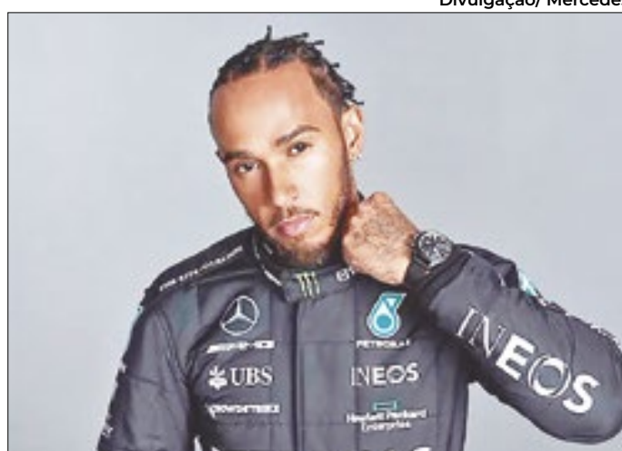
Hamilton luta pelo oitavo título na F1

De contrato renovado com a Mercedes, Hamilton hoje poderia estar fechado com a Ferrari. Ao portal "Blick", o britânico admitiu que já teve conversas casuais com a escuderia italiana. "Nunca [recebeu oferta]. Ok, definitivamente tivemos algumas conversas irrelevantes.