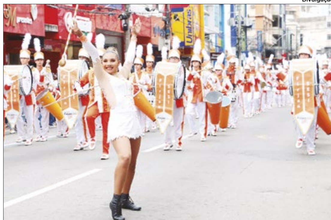
Desfile comemora aniversário de Barra Mansa

O objetivo é garantir mais atendimentos e reduzir a fila de espera da Casa da Criança. Contratando dois fonoaudiólogos, também é previsto o atendimento das crianças atendidas pelas unidades de saúde dos bairros Mirandópolis e Jardim Polastri.