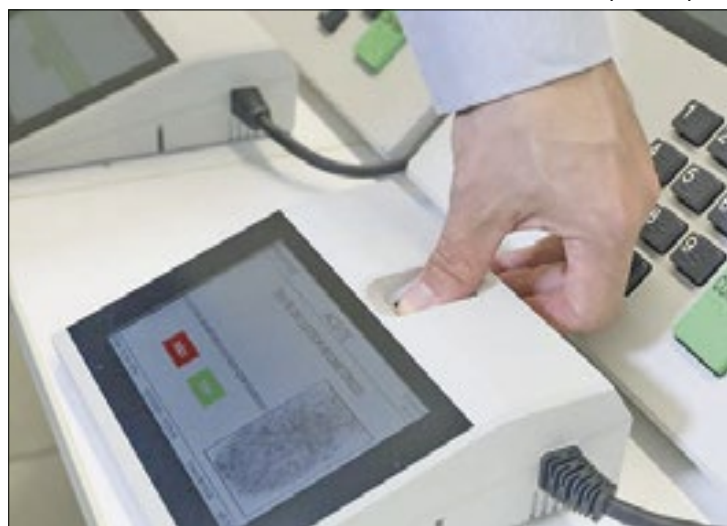
Mais de 156 milhões de pessoas estão aptas a votar

No entanto, para acessar esses mecanismos é necessário que o interessado faça uma solicitação junto ao cartório eleitoral "em tempo hábil".