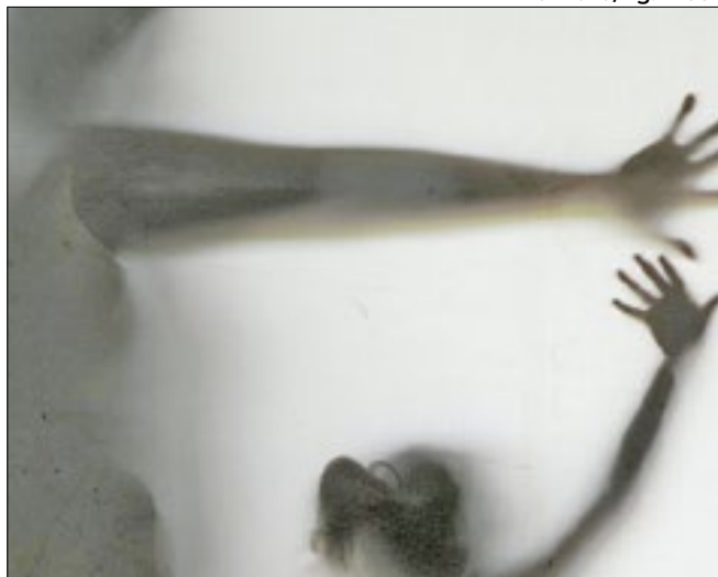
Município alerta estudantes através de palestras