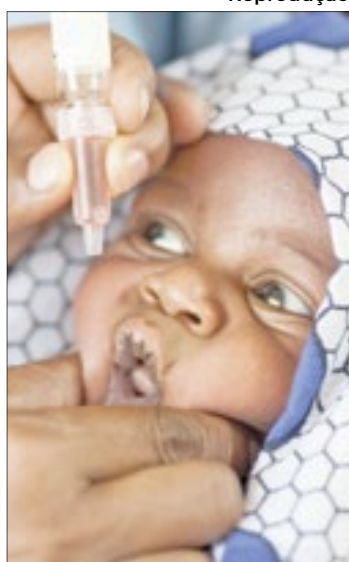
Zé gotinha em ação