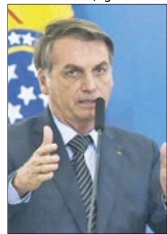
Encontro foi marcado no fim de julho