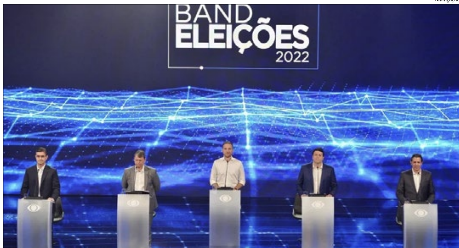
Debate em São Paulo teve acusações entre Fernando Haddad, Tarcísio de Freitas e Rodrigo Garcia

O primeiro debate entre os candidatos ao Governo do Rio marcou a tentativa de Marcelo Freixo (PSB) de colar a imagem