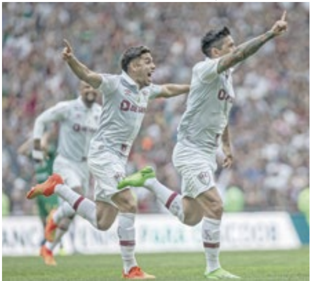
Três pontos no Maracã: Flu 1 x 0 Cuiabá