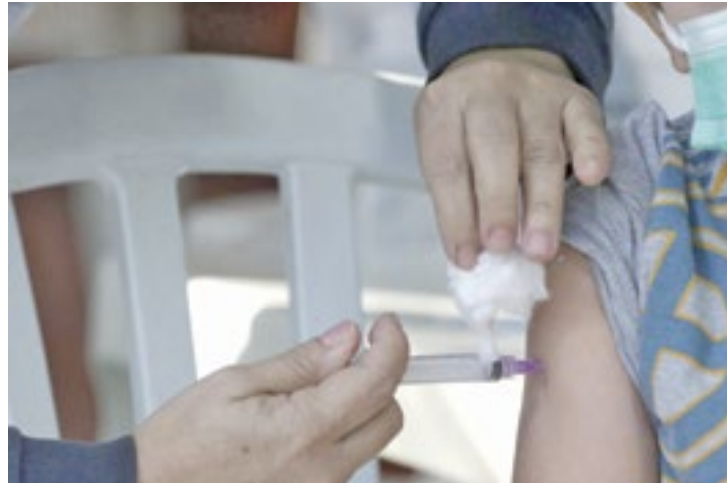
Mobilização vai até o dia 9 de setembro

A poliomielite é uma doença contagiosa aguda causada por um vírus que pode provocar paralisias irreversíveis e fatais. A vacinação é a principal forma de prevenção. O Brasil não detecta casos de poliomielite desde 1989 e, em 1994, recebeu da Organização Pan-Americana da Saúde (Opas) a certificação de eliminação da doença. Em todo o mundo, as campanhas de imunização reduziram de centenas de milhares para apenas algumas dezenas o número de casos por ano. Recentemente, porém, a doença reapareceu em alguns países, levantando um alerta.