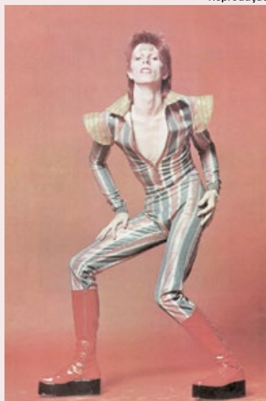
David Bowie, um ídolo camaleônico