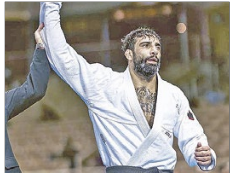
Campeão mundial foi baleado na testa após briga

Lo teria, então, derrubado o homem e o imobilizado. Outras pessoas se aproximaram e separaram a briga. O homem teria, então, sacado uma arma e, de frente para Lo, atirado uma única vez na cabeça do lutador.