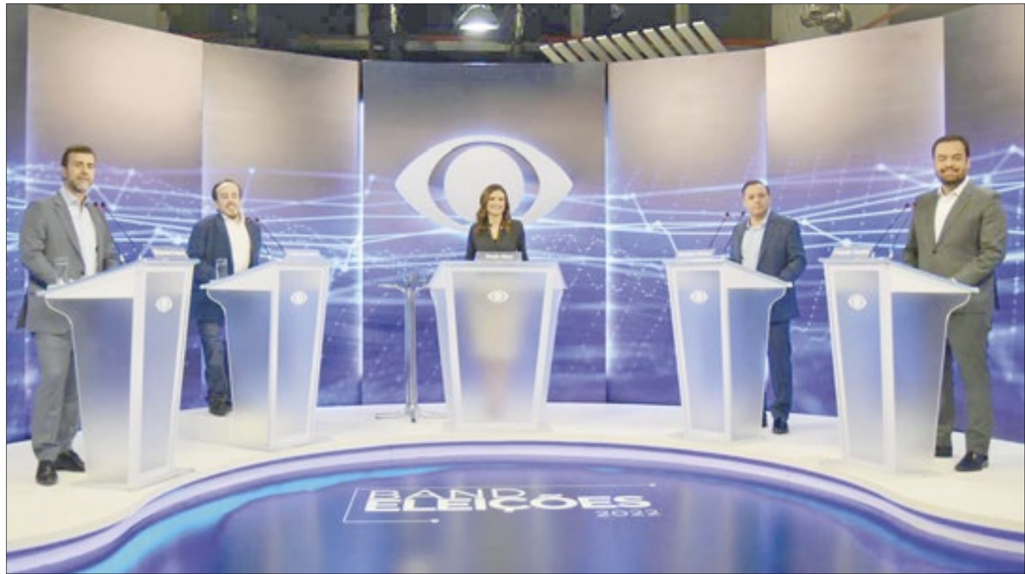
Primeiro debate a governador, na Band, foi marcado por ataques a Freixo e boa participação de Ganime