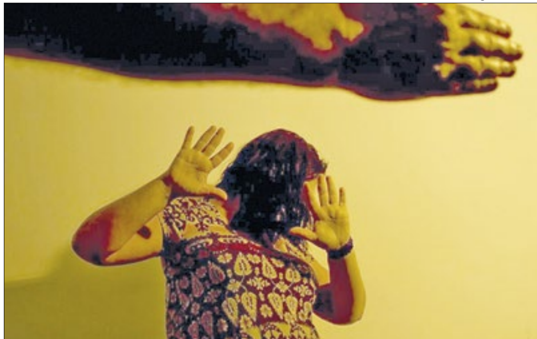
Ajuda psicológica à mulher aumentou bastante em razão da pandemia

“A gente tem registrado que principalmente durante o momento de confinamento, o número de atendimentos aumentou 700%. É um aumento muito expressivo. Em Petrópolis, nesta época de pandemia foi criada a Sala Lilás, do IML, para atender as mulheres vítimas de violência. Este local indica o CRAM para atendimento, então toda essa gama de opções de atendimentos pode ter dado coragem para