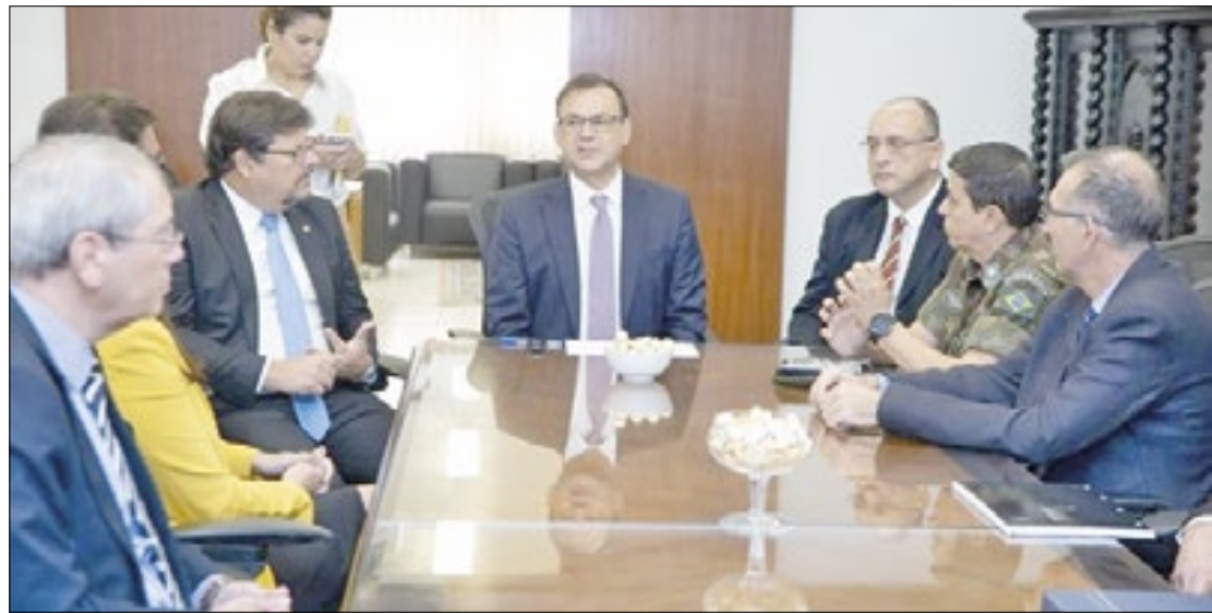
Coalizão de forças ajudará a reprimir condutas ilícitas