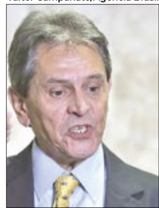
Ele participou a convenção por vídeo