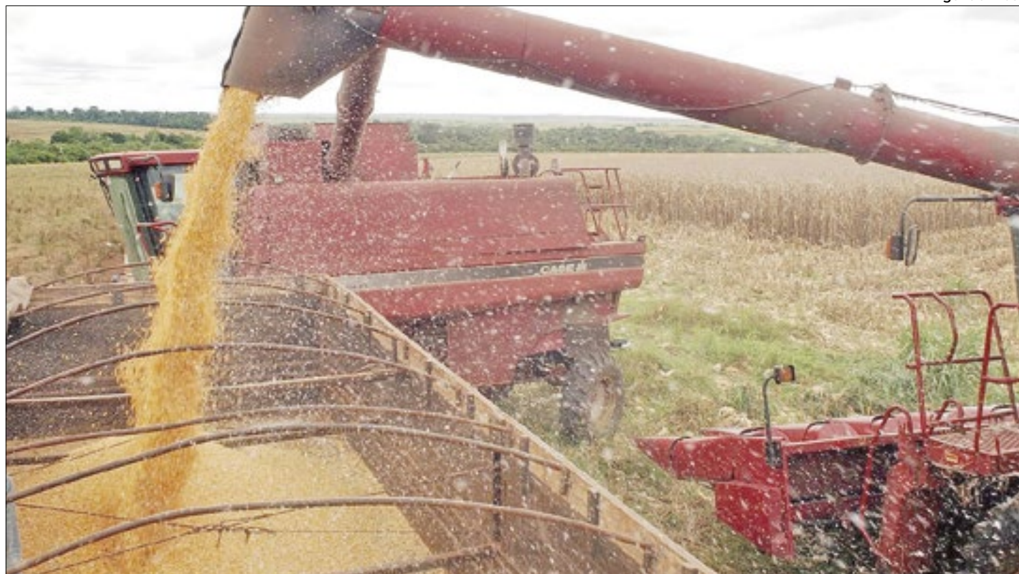
Vendas agropecuárias do país tiveram crescimento de 47,8% no acumulado do mês de julho

Até 2026, os setores de transporte e logística, e saneamento, deverão receber investimentos de R$ 60 bilhões e R$ 124 bilhões, respectivamente, estima a Associação Brasileira da Infraestrutura e Indústrias de Base (Abdib), perfazendo um montante superior a R$ 180 bilhões, por meio de concessões e parcerias público-privadas (PPPs), nas três esferas administrativas (União, estados e municípios). Neste campo, somente a privatização do Porto de Santos deverá render aos cofres federais em torno de R$ 18 bilhões.