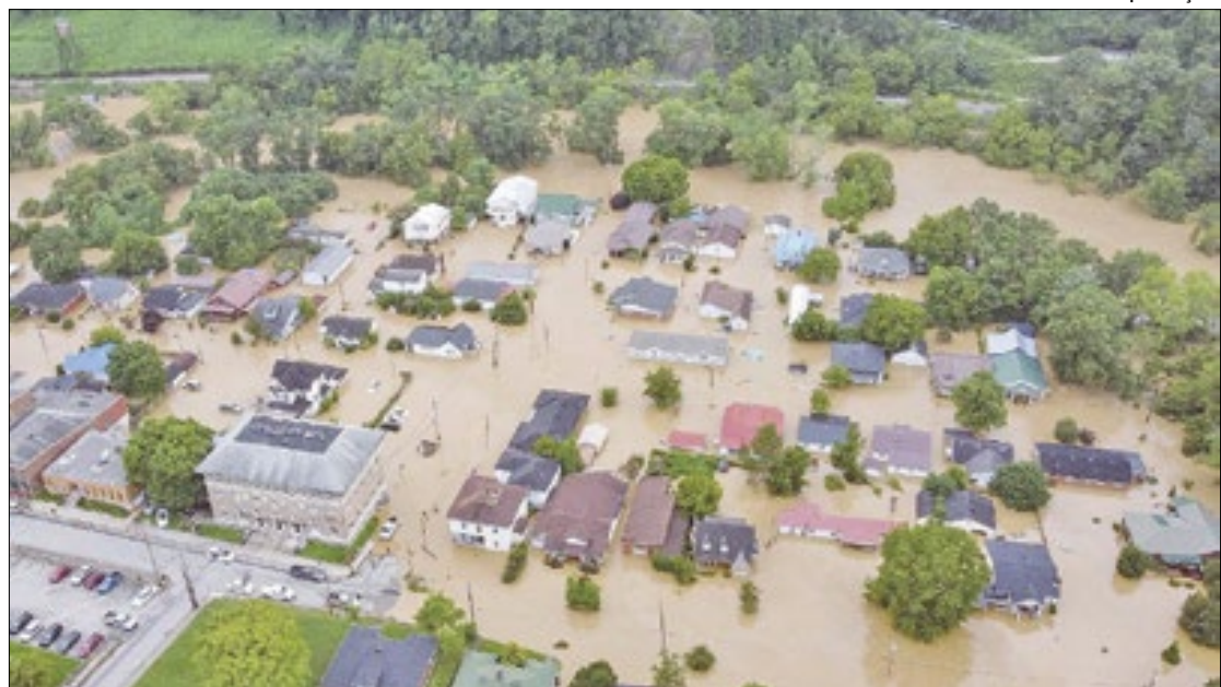
Governador do estado disse que há crianças entre as vítimas

Mais chuva pela frente As inundações transformaram muitas estradas em rios, e algumas casas em áreas baixas ficaram quase completamente submersas, apenas com os telhados visíveis.