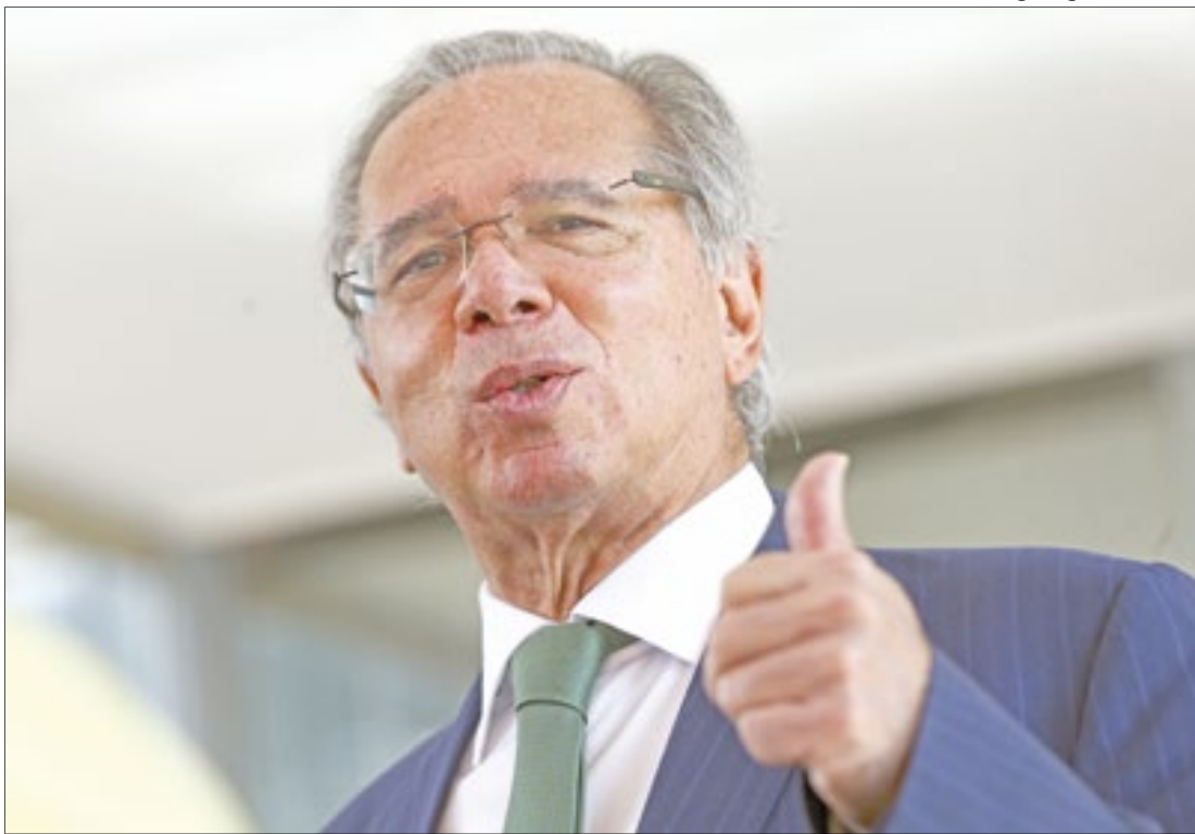
Reconhecimento veio do exterior; FMI projeta crescimento do PIB nacional

Ao mesmo tempo, a maior economia do mundo, os EUA, deverá recuar (pela segunda vez consecutiva) em 0,9% no segundo trimestre deste ano (2T22).