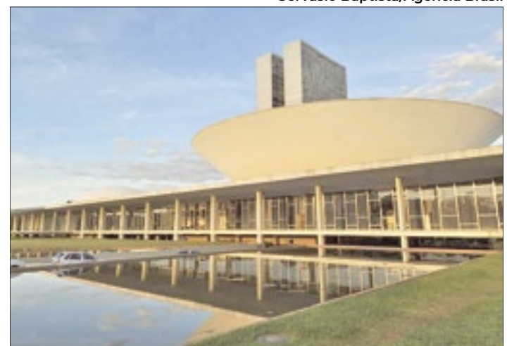
Parlamentarem ficaram 15 dias de recesso