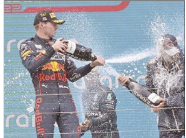
Holandês, que largou em 10º, lidera o campeonato

Atual campeão da categoria, o holandês Max Verstappen lidera o campeonato.