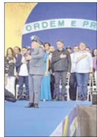
Convenção aconteceu em São Paulo