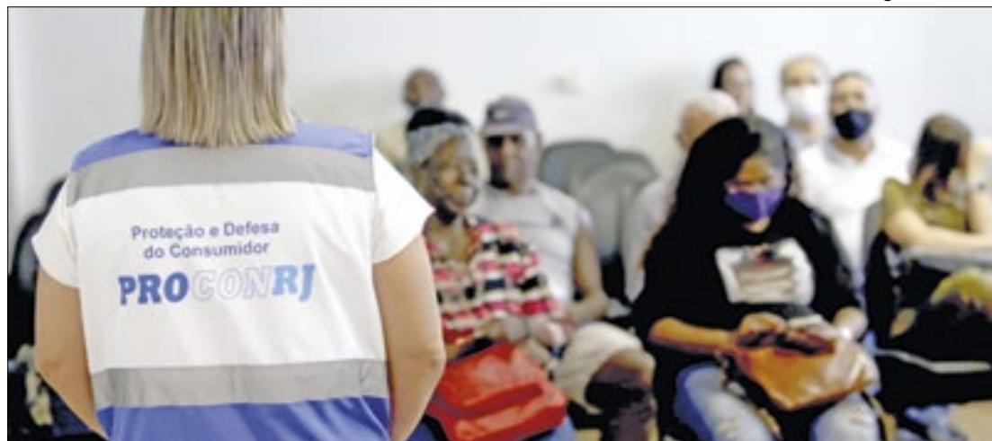
Clientes estão aproveitando ação para renegociar dívidas

A ação de negociação de débitos vem sendo realizada há duas semanas e atendeu a mais de 1.700 clientes inadimplentes de instituições financeiras e de concessionárias de serviços públicos, como água, gás, luz e energia elétrica. Dos atendimentos realizados, 68% resultaram em acordos formalizados,